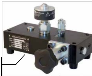
Turbinkový průtokoměr (analog)