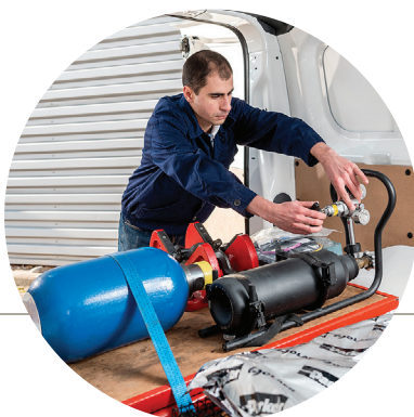
Mobilní služby – (technik k vám přiveze plně vybavené vozidlo, náhradní díly a zkušební zařízení)