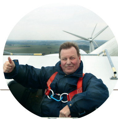
V provozu zákazníka – (technik zajistí odborné služby i v těch nejdolejších místech)