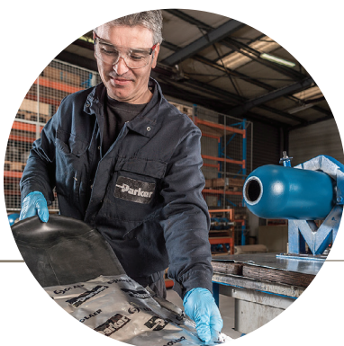
Služby v servisním centru – (na našem pracovišti)